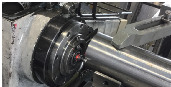
タッチファインダφ18